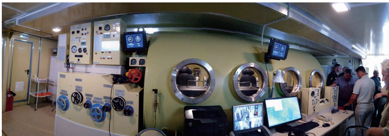
Панорамный вид МГБ в блоке барокамеры