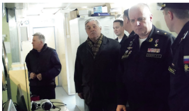
Представление изделия Начальнику Морской авиации ВМФ РФ