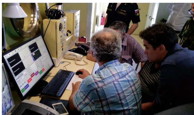
Обучение использованию системой оперативного медицинского контроля.