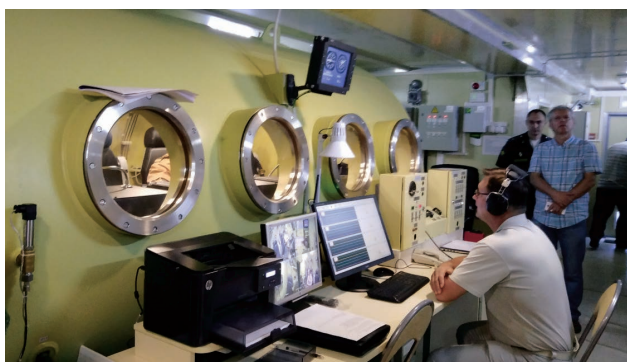
Рабочее место врача