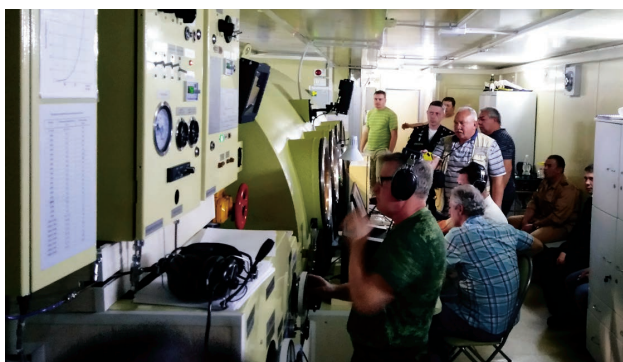
Рабочее места механика

ЗАО «СКБ ЭО при ИМБП РАН» осуществляет полный цикл разработки от идеи и чертежей до ввода в эксплуатацию, в том числе: